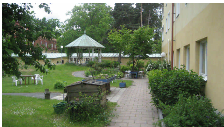
Uteplats i anslutning till parken